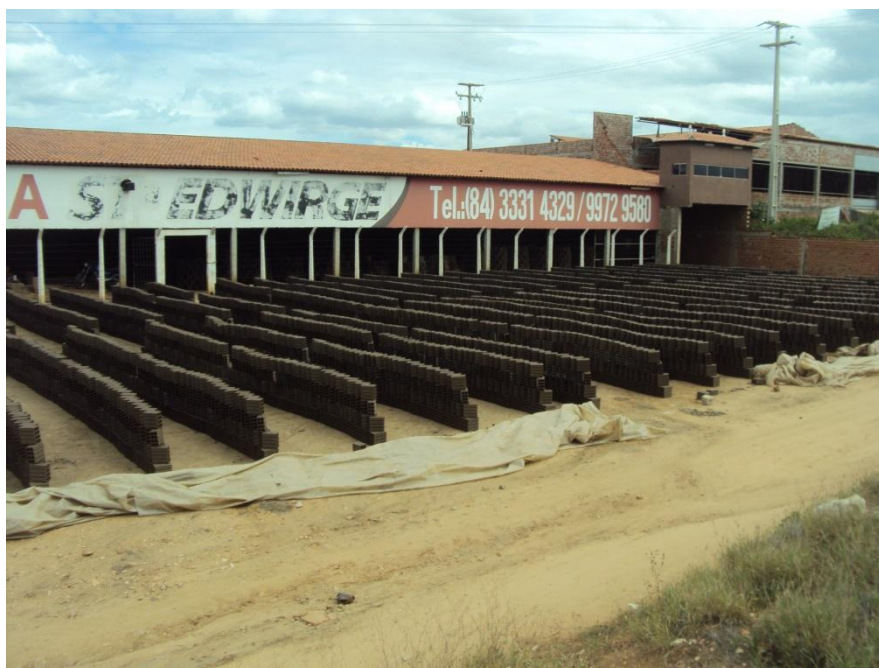
Figura 02. Secagem de blocos cerâmicos feita no sol onde já colocam um plástico.

Na Figura 03 percebemos os suportes de madeira onde são colocadas as telhas para secagem em um pátio de uma cerâmica no Rio Grande do Norte na cidade de Assú, onde pouco antes as telhas foram levadas para o forno para serem queimadas. A secagem é feita totalmente ao sol e as telhas são colocadas no período da manhã e são levadas ao forno antes das 13 horas da tarde.