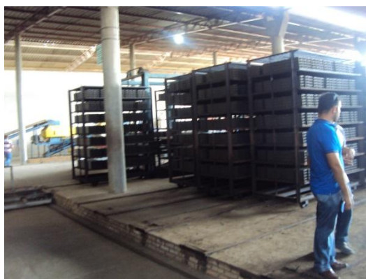
Figura 08. Blocos cerâmicos arrumados nas vagonetas.

De todas as cerâmicas visitadas, inclusive possui pouco de tempo de montagem podemos encontrar um processo de secagem dos mais modernos do Brasil. Na Figura 09 podemos ver os tijolos colocados sobre um vagão onde a superfície do vagão é confeccionada de tijolos refratários em uma cerâmica no município de Aquiraz no Ceará. Os vagões se deslocam sobre um trilho e à proporção que vão andando vários ventiladores vão tirando a umidade depois