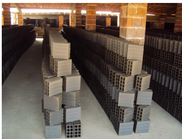
Figura 8. Empilhamento dos blocos.

Os tijolos são empilhados de uma maneira tal que não ocupe muito espaço no galpão como também tenham uma secagem mais rápida, sendo colocados muitas vezes com os furos contrários a direção dos ventos, pois se forem colocados com os furos no mesmo sentido da ventilação natural os blocos trincam, como aconteceu recentemente em uma cerâmica no município de Maracanaú, que inclusive colocou uma parede em alvenaria para barrar a ventilação devido a grande quantidade de peças trincadas antes de entrar no forno. A Figura 8 mostra o empilhamento dos blocos no Ceará percebendo-se que os que estão em maior contato com o ar estão menos úmidos.