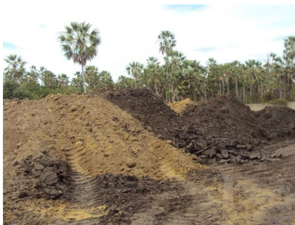
Figura 1: Estoque de argila onde temos uma argila magra (de cor clara) e outra gorda (mais escura).

A Figura 1 mostra um estoque de argila onde podemos perceber a existência de uma argila magra (de cor clara) e outra argila, gorda (mais escura), com menor quantidade de sílica.