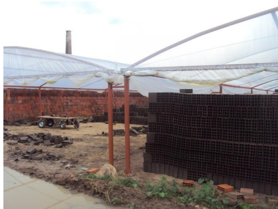
Figura 01. Lona plástica para acelerar a secagem.

Hoje a cerâmica no município de Maracanaú no Ceará, fez um galpão onde colocou uma lona plástica para acelerar a secagem e aumentar o espaço para colocação de tijolos que saem da extrusora, conforme mostra a Figura 01. Observa-se uma grande perda de tijolos logo após uma chuva que ocorreu na região.