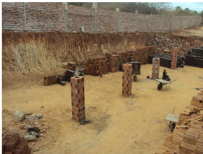
Figura 6. Blocos sendo colocados ao relento para secar.

Na Figura 6 percebemos os blocos sendo colocados ao relento, ou seja, no sol entre os pilares de um galpão que estava sendo construído em uma cerâmica em Groaíras no Ceará onde se percebe carrinhos com tijolos que saíram da maromba.