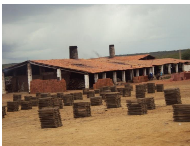
Figura 03. Suportes de madeira onde são colocadas as telhas. Fonte: própria, 2013.

Na Figura 03 percebemos os suportes de madeira onde são colocadas as telhas para secagem em um pátio de uma cerâmica no Rio Grande do Norte na cidade de Assú, onde pouco antes as telhas foram levadas para o forno para serem queimadas. A secagem é feita totalmente ao sol e as telhas são colocadas no período da manhã e são levadas ao forno antes das 13 horas da tarde.