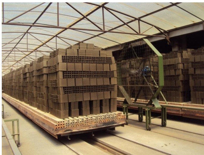
Figura 09. Tijolos colocados sobre um vagão.

que eles saem do secador. Os tijolos são arrumados sobre o vagão assim que saem da maromba. O galpão também funciona como uma estufa. De todas as cerâmicas visitadas a cerâmica de Aquiraz foi que apresentou melhor processo de secagem de grande avanço tecnológico.