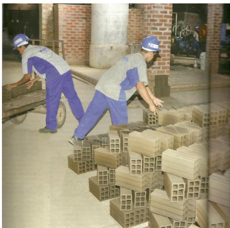
Figura 04. Blocos que ficam mais atrás da empilha não estão totalmente secos sendo levados para o forno.

Não ser meteorologista e instalar um equipamento de estufa (secador) que regulariza a produção no ano inteiro, pois mesmo que venha a chover você tem como secar os blocos e telhas. Os fabricantes de telhas de Russas no Ceará sabem mais sobre o clima que o pessoal da FUCEME (Fundação Cearense de Meteorologia), pois sabem até quando vai chover e muitas vezes colocam as telhas úmidas ao sol para secarem.