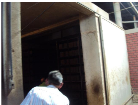
Figura 07. Entrada de um secador artificial. Fonte: própria, 2013.

Algumas cerâmicas no Ceará já possuem secadores automáticos para fazerem a secagem artificial de seus produtos. A Figura 07 mostra a entrada de um secador artificial em uma cerâmica próxima a Fortaleza. O secador possui quase 10 metros de comprimento. Na Figura 08 percebemos os blocos cerâmicos arrumados nas vagonetas que serão transportados da maromba até o secador.