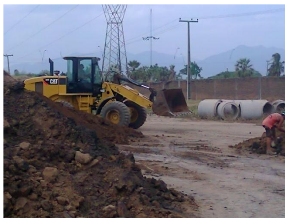
Figura 02. Argila úmida no pátio.

Até pouco tempo, no período do inverno uma cerâmica em no município de Maracanaú no Ceará, colocava os tijolos de menor umidade, ou seja, que já tinha saído da maromba e colocado no pátio (galpão) em cima das fornalhas do forno Redondo (Abóboda) para secar (diminuir a umidade), pois ficava em um lugar mais elevado e aumentar o espaço no galpão para colocar novos tijolos que saiam da maromba. Além do aumento da mão de obra os pesos dos tijolos danificavam estrutura da fornalha do forno. A Figura 3 mostra a argila úmida no pátio de uma empresa onde a pá carregadeira via levar a argila para o caixão alimentador.